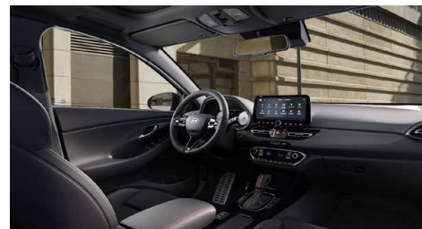
Černý interiér N line – látkové čalounění s červeným prošíváním a logem N – černé čalounění stropu a obložení bočních sloupků – červeně prošívání sportovní volant, hlavice řadící páky a loketní opěrka