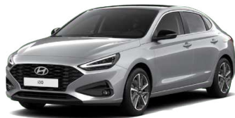
Shimmering Silver Metallic Metalická Cena: 16 900 Kč