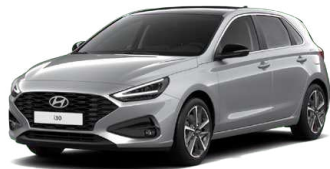
Shimmering Silver Metallic Metalická Cena: 16 900 Kč