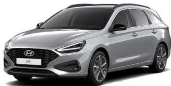
Shimmering Silver Metallic Metalická Cena: 16 900 Kč