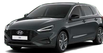
Cypress Green Pearl Perleťová Cena: 16 900 Kč