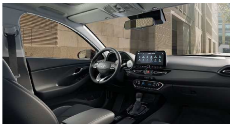
Černý interiér Oceanidis Black – látkové čalounění sedadel – světlé čalounění stropu a obložení bočních sloupků – černé provedení přístrojové desky a výplní dveří