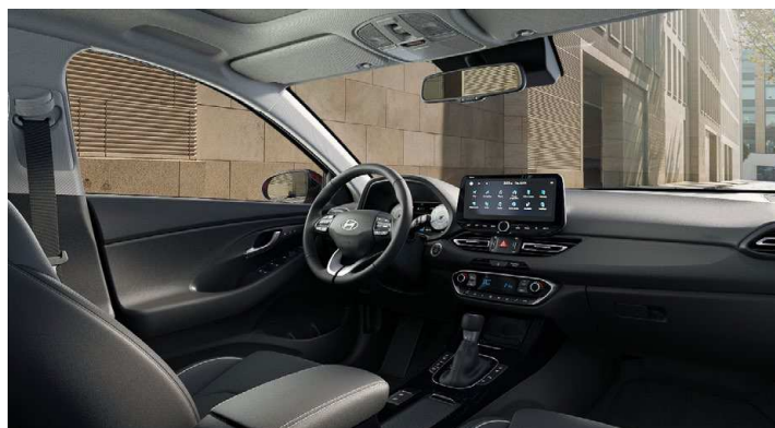
Černý interiér Oceanic Black Premium – kožené čalounění sedadel – černé čalounění stropu a obložení bočních sloupků – světlé čalounění stropu a obložení bočních sloupků – černé provedení přístrojové desky a výplní dveří