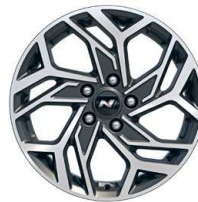
17" kola z lehké slitiny – N Line