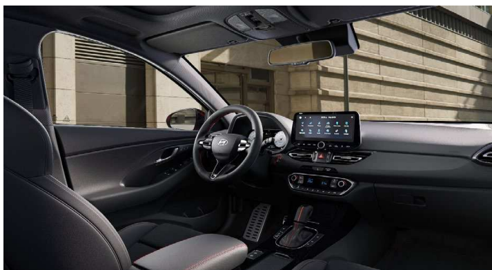
Černý interiér N line – látkové čalounění s červeným prošíváním a logem N – černé čalounění stropu a obložení bočních sloupků – červeně prošívání sportovní volant, hlavice řadící páky a loketní opěrka