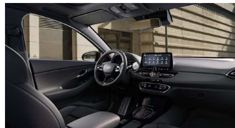
Černý interiér N line – látkové čalounění s červeným prošíváním a logem N – černé čalounění stropu a obložení bočních sloupků – červeně prošívavý sportovní volant, hlavice řadící páky a loketní opěrka