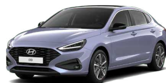
Meta Blue Pearl Perleťová Cena: 16 900 Kč