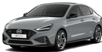
Shadow Gray Pastelová Cena: 16 900 Kč Dostupná pouze pro výbavy N Line