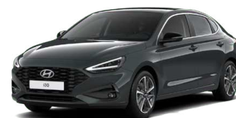
Cypress Green Pearl Perleťová Cena: 16 900 Kč