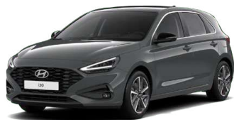
Ecotronic Gray Pearl Perleťová Cena: 16 900 Kč