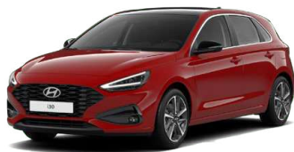
Engine Red Pastelová Cena: 0 Kč