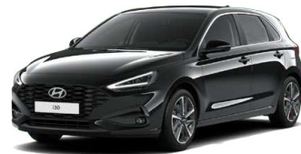
Abyss Black Pearl Perleťová Cena: 16 900 Kč