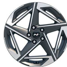
18" kola z lehké slitiny – N Line

* K dispozici pro vozy vyrobené do 9/2024.