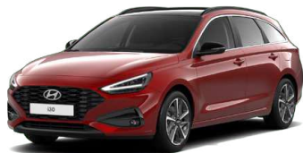
Ultimate Red Metallic Metalická Cena: 16 900 Kč