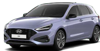
Meta Blue Pearl Perleťová Cena: 16 900 Kč