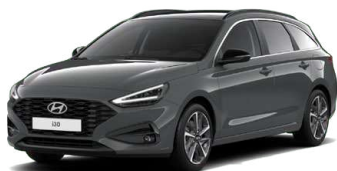
Ecotronic Gray Pearl Perleťová Cena: 16 900 Kč