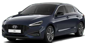
Sailing Blue Pearl Perleťová Cena: 16 900 Kč