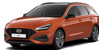
Jupiter Orange Metallic Metalická Cena: 16 900 Kč