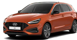
Jupiter Orange Metallic Metalická Cena: 16 900 Kč