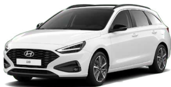
Atlas White Pastelová Cena: 5 900 Kč