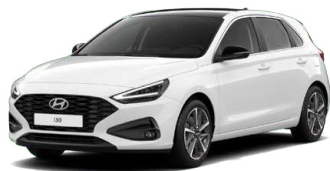
Atlas White Pastelová Cena: 5 900 Kč