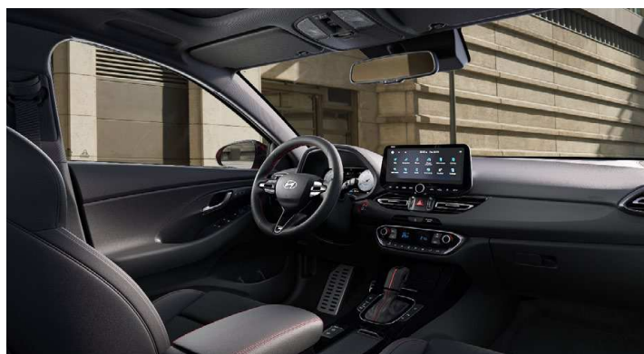
Černý interiér N line Premium – prémiové čalounění v kombinaci kůže/semiš – černé čalounění stropu a obložení bočních sloupků – červeně prošívání sportovní volant, hlavice řadící páky a loketní opěrka