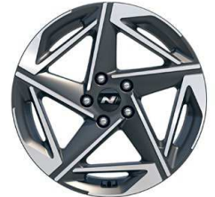
18" kola z lehké slitiny – N Line

* K dispozici pro vozy vyrobené do 9/2024.