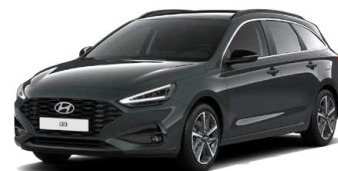
Cypress Green Pearl Perleťová Cena: 16 900 Kč