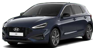
Sailing Blue Pearl Perleťová Cena: 16 900 Kč