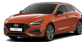
Jupiter Orange Metallic Metalická Cena: 16 900 Kč