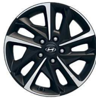
17" kola z lehké slitiny