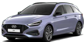
Meta Blue Pearl Perleťová Cena: 16 900 Kč