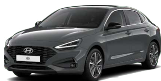
Ecotronic Gray Pearl Perleťová Cena: 16 900 Kč