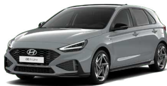
Shadow Gray Pastelová Cena: 16 900 Kč Dostupná pouze pro výbavy N Line