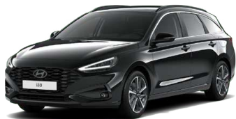
Abyss Black Pearl Perleťová Cena: 16 900 Kč