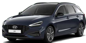
Sailing Blue Pearl Perleťová Cena: 16 900 Kč