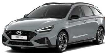
Shadow Gray Pastelová Cena: 16 900 Kč Dostupná pouze pro výbavy N Line