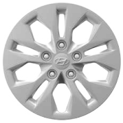
15" ocelová kola s celoplošnými kryty