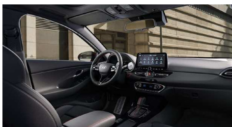
Černý interiér N line Premium – prémiové čalounění v kombinaci kůže/semiš – černé čalounění stropu a obložení bočních sloupků – červeně prošívavý sportovní volant, hlavice řadící páky a loketní opěrka