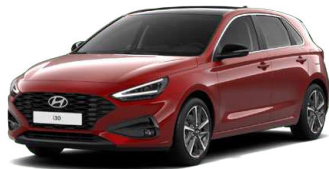
Ultimate Red Metallic Metalická Cena: 16 900 Kč