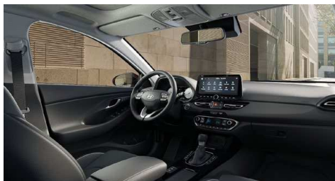
Černý interiér Oceanidis Black – látkové čalounění sedadel – světlé čalounění stropu a obložení bočních sloupků – černé provedení přístrojové desky a výplní dveří