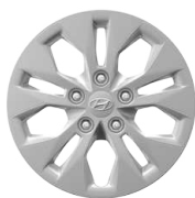
15" ocelová kola s celoplošnými kryty