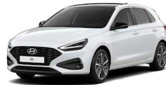
Serenity White Pearl Perleťová Cena: 16 900 Kč