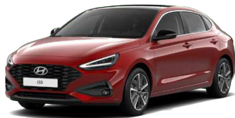
Ultimate Red Metallic Metalická Cena: 16 900 Kč