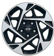
16" kola z lehké slitiny