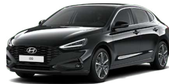
Abyss Black Pearl Perleťová Cena: 16 900 Kč