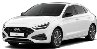
Atlas White Pastelová Cena: 5 900 Kč