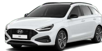
Serenity White Pearl Perleťová Cena: 16 900 Kč