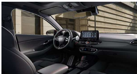
Černý interiér N line Premium – prémiové čalounění v kombinaci kůže/semiš – černé čalounění stropu a obložení bočních sloupků – červeně prošívání sportovní volant, hlavice řadící páky a loketní opěrka