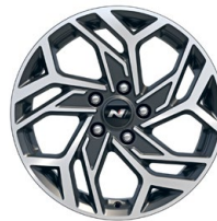
17" kola z lehké slitiny – N Line