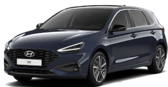
Sailing Blue Pearl Perleťová Cena: 16 900 Kč