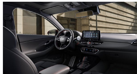
Černý interiér N line – látkové čalounění s červeným prošíváním a logem N – černé čalounění stropu a obložení bočních sloupků – červeně prošívání sportovní volant, hlavice řadící páky a loketní opěrka