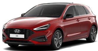
Ultimate Red Metallic Metalická Cena: 16 900 Kč