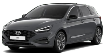
Ecotronic Gray Pearl Perleťová Cena: 16 900 Kč