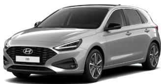
Shimmering Silver Metallic Metalická Cena: 16 900 Kč