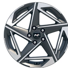
18" kola z lehké slitiny – N Line

* K dispozici pro vozy vyrobené do 9/2024.