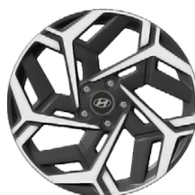
Unikátní N Line 18" kola z lehké slitiny

www.porovnejhyundai.cz (Porovnejte si vozy Hyundai s konkurencí)